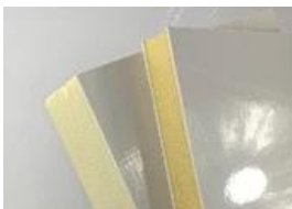
Panneau de mousse de FRP PU

Prix: élevé à bas Isolation: □□□□ Force: □