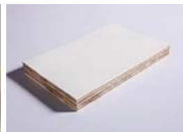
Panneau de contreplaqué de FRP

Prix: élevé à bas Isolation: □□ Force: □□□□