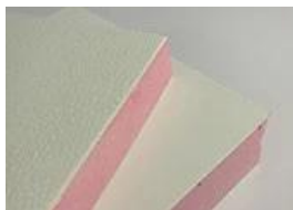
Panneau FRP XPS

Prix: élevé à bas Isolation: □□□ Force: □□