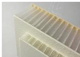
FRP PP Panel de nido de abeja