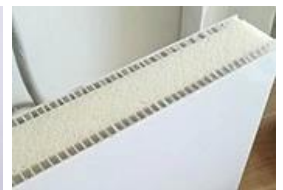
Dos o más tipos principales

Precio: de mayor a menor Aislamiento: □□□□ Fuerza: □□□□