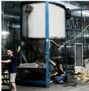
RAW MATERIALS PROCESSING