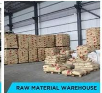
RAW MATERIAL WAREHOUSE