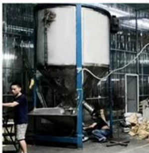
RAW MATERIALS PROCESSING